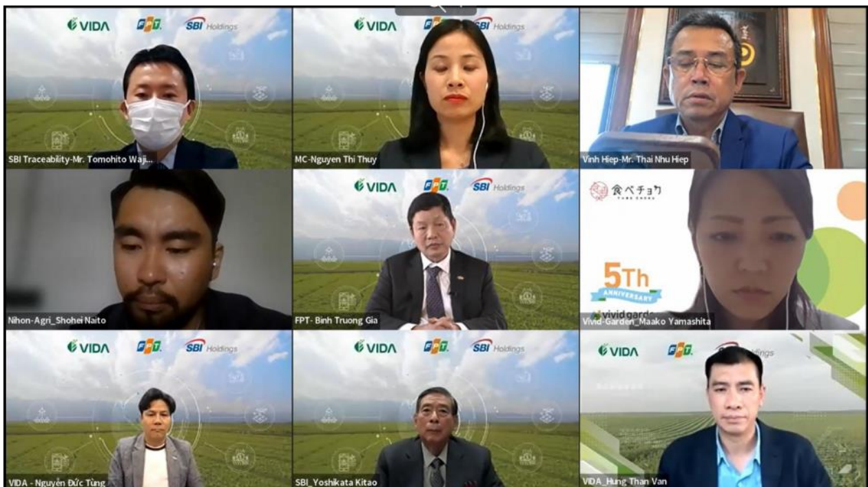
フォーラムに参加されていた登壇者の方々

このフォーラムは、日本のAgriTech企業とベトナムを代表する農産品について紹介いただく場として設定され、日越両国企業間におけるビジネスパートナーシップ構築の第一歩になることを願い開催されました。日本やベトナムの多くの企業・団体が日本のAgriTech技術やベトナムの農産物分野に積極的に関心を持ち、サプライヤーや消費者に最適な生産モデルとラインを追求する機会となりました。